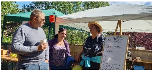
Les plus jeunes rencontrent les anciens