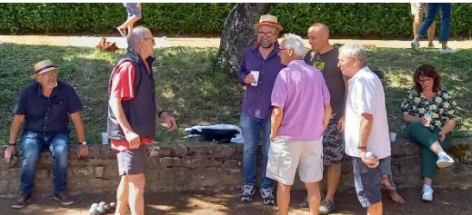
Les joueurs cherchent l'ombre côté montagne