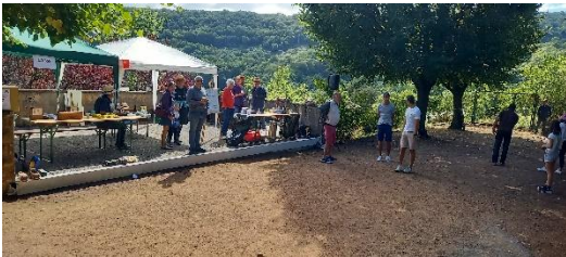
Les vainqueurs nous offrent un joli spectacle